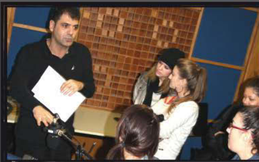
Στο ραδιοφωνικό σταθμό της EPT3