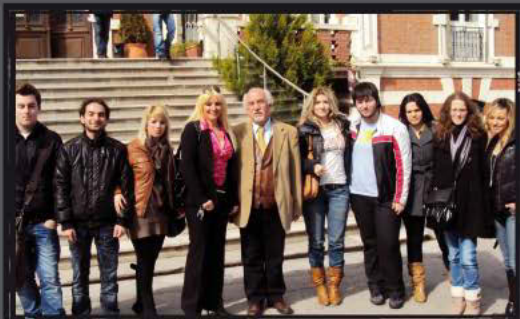
Στην Περιφέρεια Κεντρικής Μακεδονίας