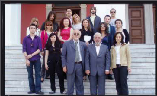
Στο Υπουργείο Μακεδονίας – Θράκης