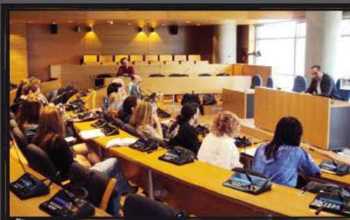
Στην αίθουσα συνεδριάσεων του Δημοτικού Συμβουλίου Θεσσαλονίκης