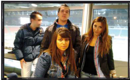
Στα δημοσιογραφικά θεωρεία του Καυτατζόγλειου σταδίου