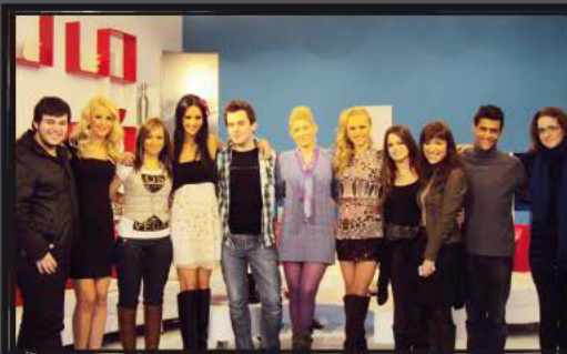
Στο πλατό της εκπομπής «Κορίτσια για σπίτι» του MAKEDONIA TV