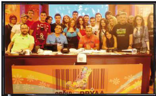
Στο πλατό της εκπομπής ΡΑΔΙΟ ΑΡΒΥΛΑ του ΑΝΤ1