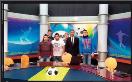
Στα πλατό της εκπομπής Derby του MAKEDONIA TV